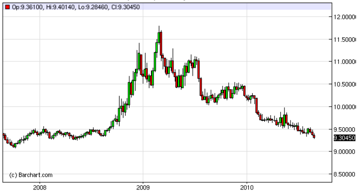
Grafic 3: Evolutia din ultimii 3 ani a cursului spot forex al monedei unice europene in fata coroanei suedeze (copyright 2010 Thomson Reuters)