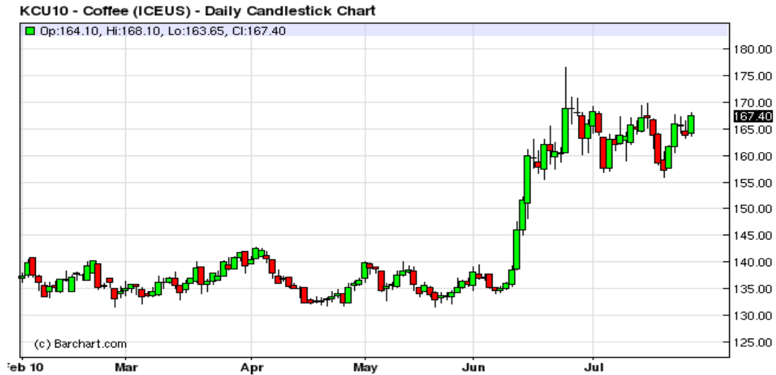
Grafic 1: Evolutia recenta a pretului futures al cafelei cu scadenta septembrie 2010 cotat la ICE